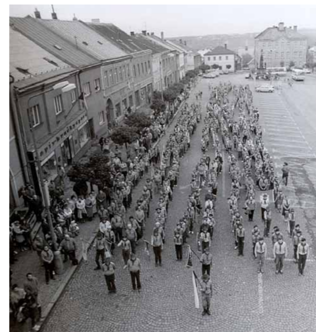
Obr. 10/14: Slavnostní průvod městem při 70. výročí založení skautingu ve Skutči na podzim v roce 1990.

V roce 1990 proběhly oslavy 70. výročí založení skautingu ve Skutči. Byly uspořádány Junácké dny s průvodem městem, kterých se účastnilo 900 hostů z 22 středisek. Slavnosti byly spojeny s oslavami 28. října a ve dnech 20. října až 4. listopadu proběhla skautská výstava „Co nás zajímá, co děláme, jak žijeme“.