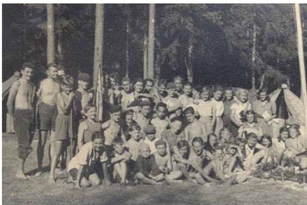
Obr. 10/9: Letní tábor u Valtína roku 1949.

Od dubna 1948 byl na Junáka vyvinut veliký politický nátlak. Junák byl zbaven členství v Mezinárodním skautském ústředí a byl plně začleněn do Svazu československé mládeže. Došlo k zákazu některých letních táborů a odvolání Valného sněmu Junáka ve Zlíně. Ve Skutči navzdory tomu skauting pokračoval ve své činnosti.