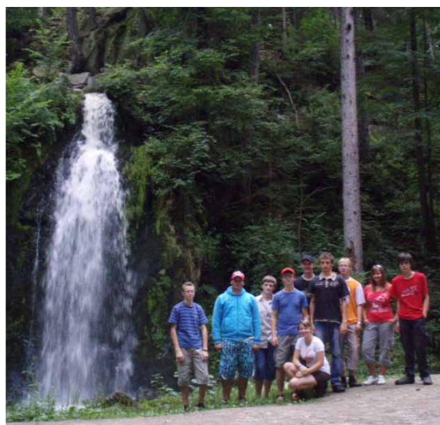
Obr. 10/19: Roverský kmen na výpravě v přírodě roku 2010.