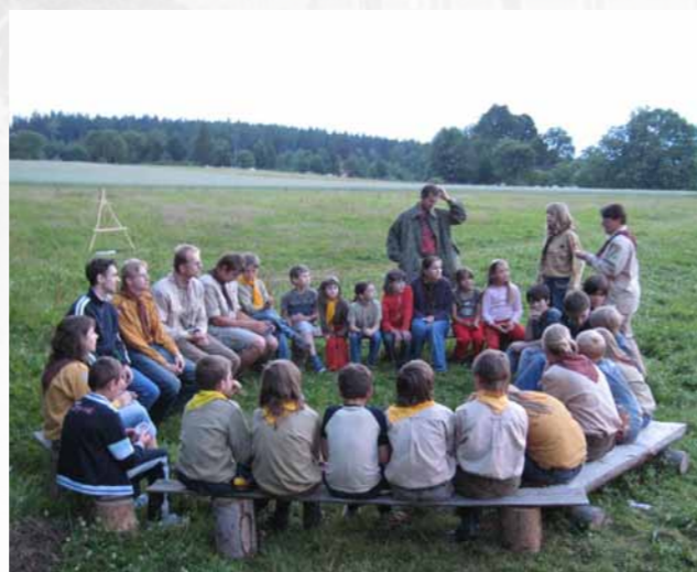
Obr. 10/18: II. oddíl na táboře na Čachnově roku 2008.