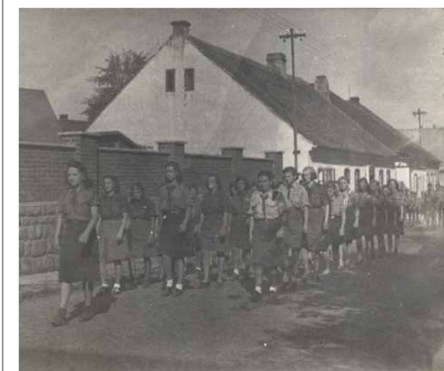
Obr. 10/7: Okrskový sjezd junáků ve Skutči, 20.–21. září 1947.

Ze skautských akcí je nutné uvést okrskový sjezd junáků ve Skutči pořádaný ve dnech 20.–21. září 1947. Mezi oddílové tradice patřilo organizování táborového nebo oddílového ohně na „Kozím hrádku“ pod lomem Litická, kde se skládaly sliby a odborné zkoušky. 6