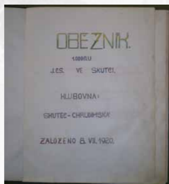
Obr. 10/2: Nejstarší dochovaný pramen skutečského skautu, kronika z roku 1920, str. 1.

Junák se také aktivně účastnil veřejného života ve městě. Každoročně pořádá několik táborových ohňů pro příznivce skautingu s dobrovolným vstupným, které sloužilo na nákup táborových potřeb a na příspěvek sociálně slabším členům na zakoupení kroje. 2