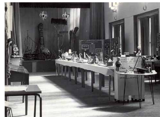
Obr. 10/15: Junácká výstava uspořádána v roce 1990 při 70. výročí založení skautingu ve Skutči.