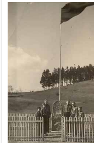
Obr. X/ 6: Pietní trýzna 1946.

vedl středisko Josef Ptáček a v roce 1949 Antonín Hejzlar, který z důvodů neshod vedoucích činnost střediska ukončil. Někteří členové chtěli totiž vést skutečský skauting jen ve skautské tradici, ale jiní byli pro začlenění skautských tradic pod Svaz české mládeže, a to díky II. Junáckému sněmu z 10. února 1946, na kterém bylo rozhodnuto o zařazení Junáka do Svazu české mládeže. Nadále zůstal český Junák členem mezinárodní skautské organizace. Skutečský skauting do ukončení pořádá tradiční schůzky, výpravy, tábory a táborové ohně pro veřejnost.