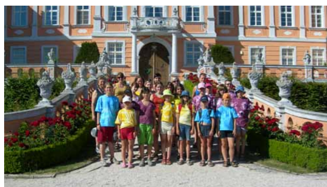
Obr. 10/17: I. oddíl na letním táboře na „Váškově louce“ u Zderaze roku 2010. Na výletě v Nových Hradech.