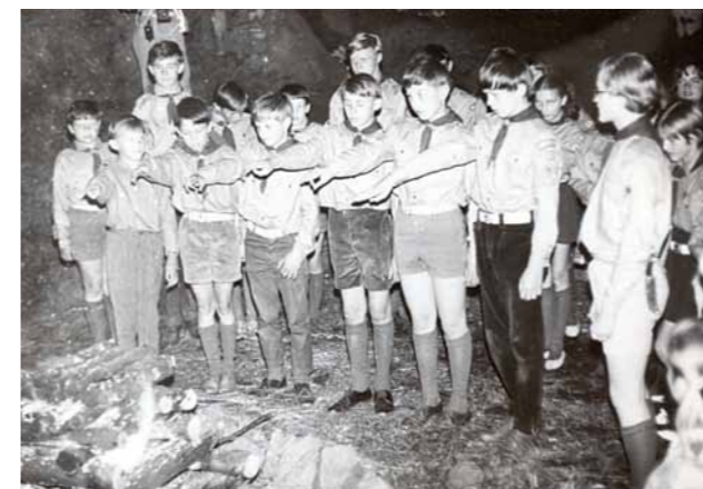
Obr. 10/11: Slib vlčat v Horkách v roce 1969.

Osudný 21. srpen 1968 neměl na skutečský skauting žádný vliv. Hned 25. srpna byla uspořádána skautská výstava pro veřejnost, která trvala do 7. září. Následně proběhl 27. října táborový oheň na počest 50. výročí vyhlášení republiky. Na podzim mělo skutečské středisko 4 oddíly s počtem kolem 100 dětí. Všeobecně se zdálo, že skauting bude moci nadále fungovat. Ve dnech 23.–24. listopadu byly na III. Junáckém sněmu schváleny stanovy Junáka.