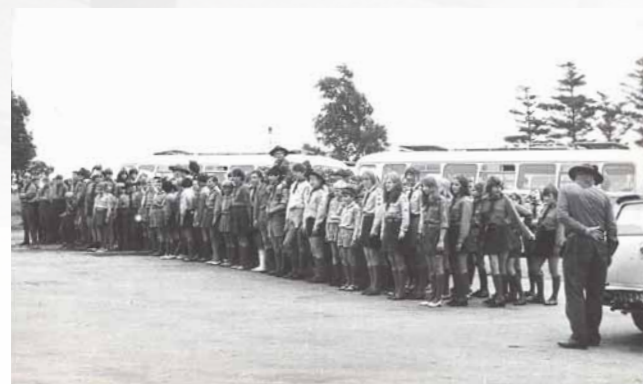
Obr. 10/13: Poslední výlet Střediska Skuteč v roce 1969.

Na konci srpna bylo zrušení Junáka již jen otázkou času. Ve Skutči naposledy zaplápolal táborový oheň v Malhošti a skutečtí skauti se rozloučili 29. srpna na celostřediskovém výletu k Třebetochovickému betlému, do ZOO ve Dvoře Králové, okolí Náchoda, pevnosti Dobrošov a Masarykovy chaty.