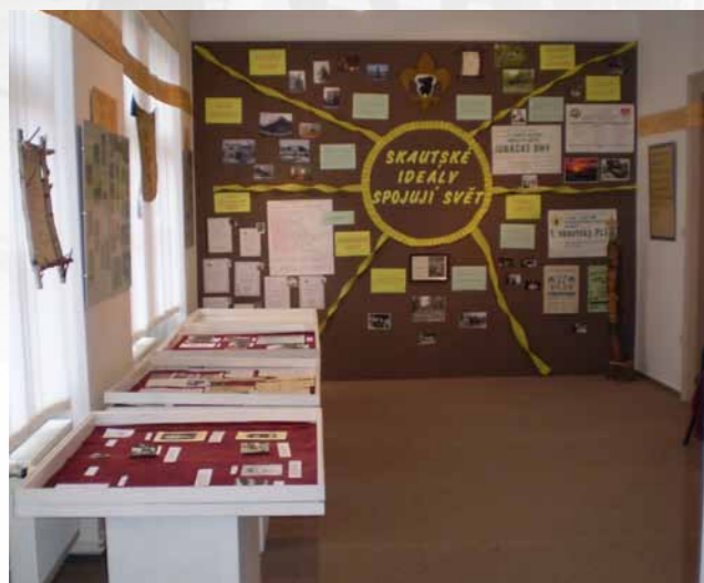
Obr. 10/16: Junácká výstava pořádána v roce 2010 při 90. výročí založení skautingu ve Skutči.