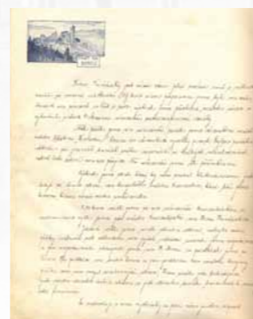
Obr. 10/3: Nejstarší dochovaný pramen skutečského skautu, kronika z roku 1920, str. 30.