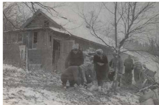
Obr. 10/10: Skautský dům v letech 1968–1970 v Horkách pod Litickou č. p. 686

Skutečský skauting měl nejdříve možnost se scházet v klubovně kynologického klubu, později od MNV získal skautský